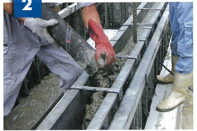
生コン打設、バイブレーター