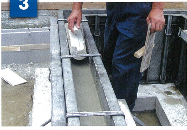
天端をコテにより均す