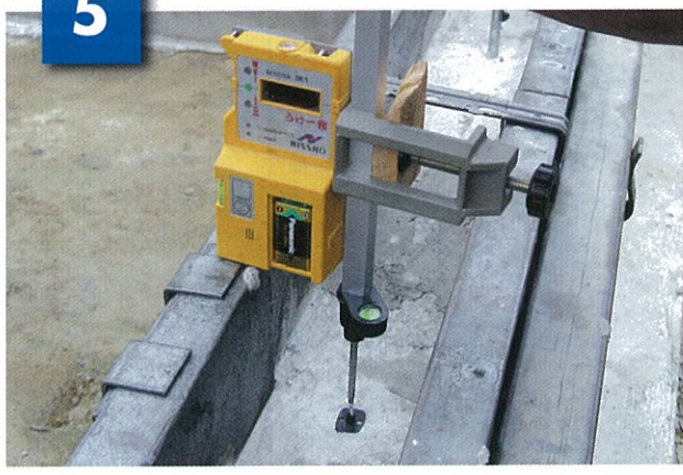
水平器付ドライバーとレーザーにより ビスの高さを調節する。