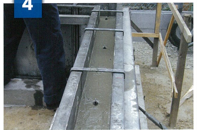
レベルビスをポイントに配置する